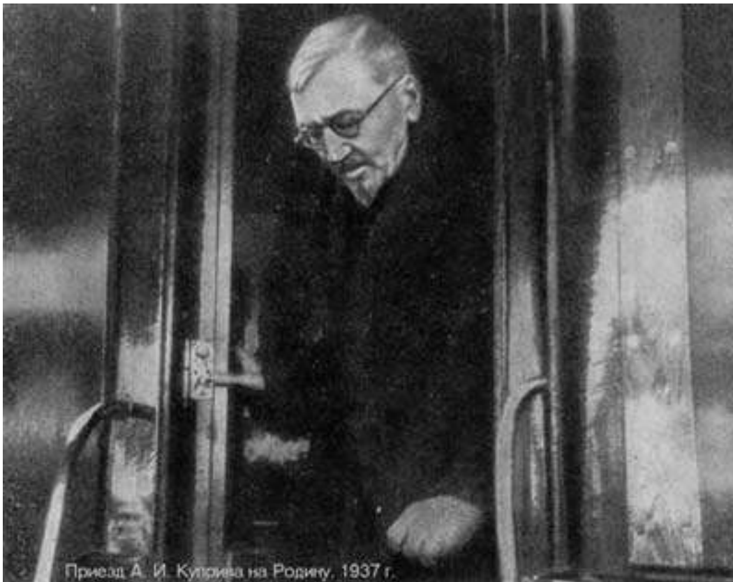
Приезд А. И. Кутрива на Родину, 1937 г.

1960 — В СССР вышел первый номер еженедельника «Футбол». Первое регулярное специализированное футбольное издание в стране. С 1967 г. - «Футбол-Хоккей»