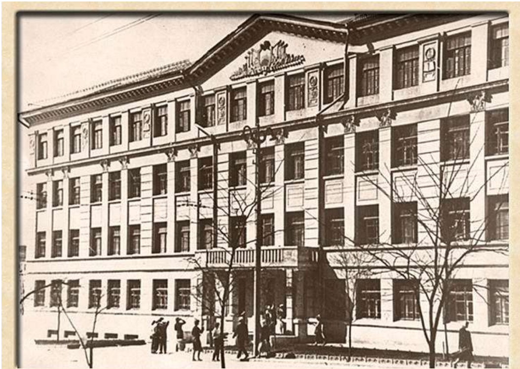
Перший корпус університету (60-ті роки)

1965 — В Берліне завершився XVI чемпіонат Європи по боксу, на якому радянські боксери завоювали вісім золотих медалей з десяти.